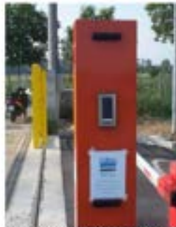
Colonnina di accesso