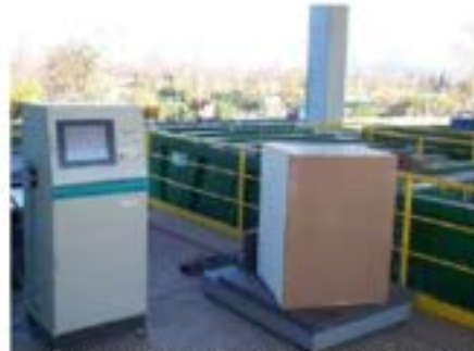
Terminale e pesa di piccola portata