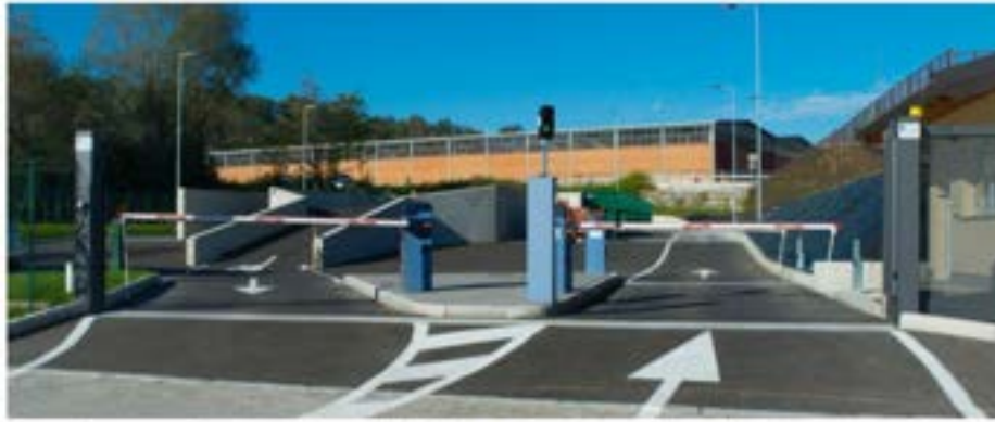
Ingresso di centro di raccolta informatizzato, con sbarre di accesso e uscita